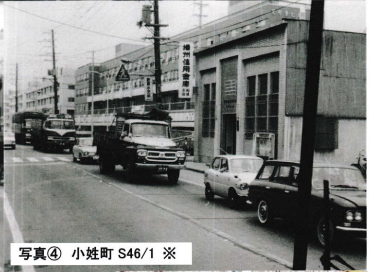
写真④ 小姓町 S46/1 ※