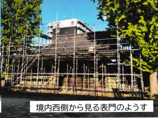
境内西側から見る表門のようす

当会活動拠点のひとつである船場本徳寺では、大玄関・表門・本堂の修復工事が順次行われています。大玄関の修復を終え、9月より表門の修復工事が始まっています。解体を伴う作業のために表門全体に足場が組まれており、見慣れた山門風景は暫く見る事ができなくなりました。