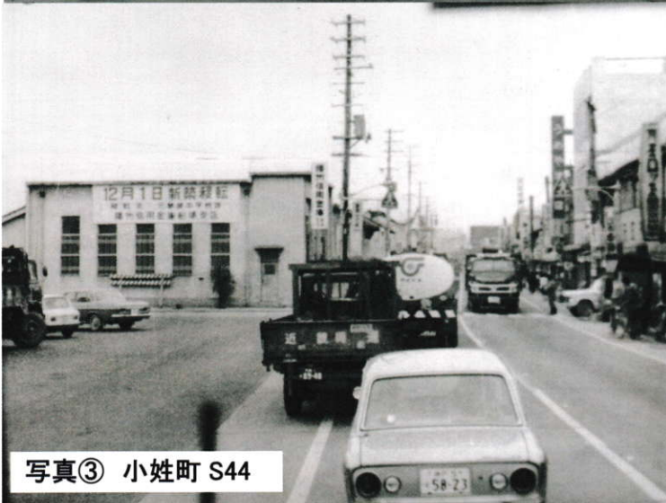
写真③ 小姓町 S44