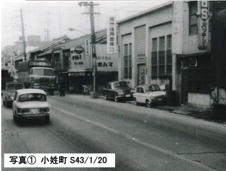
写真① 小姓町 S43/1/20

私たちの街の歴史がわかると、今の街並みをもっと輝いて見えてきますよ。(紙面作成・編集:原 隆 校了:下山裕史)