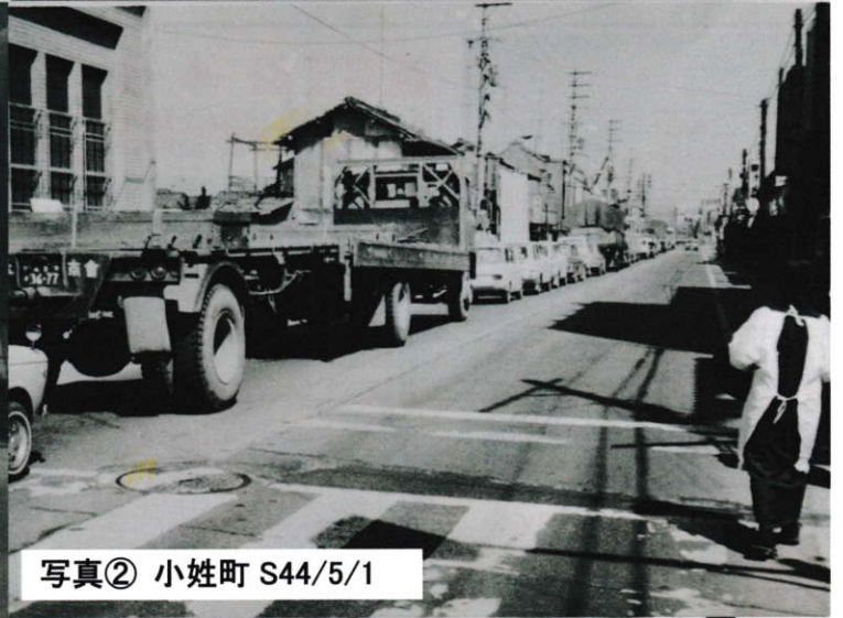
写真② 小姓町 S44/5/1