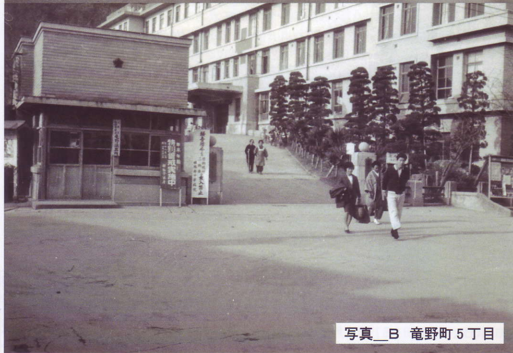
写真_B 龍野町 5 丁目