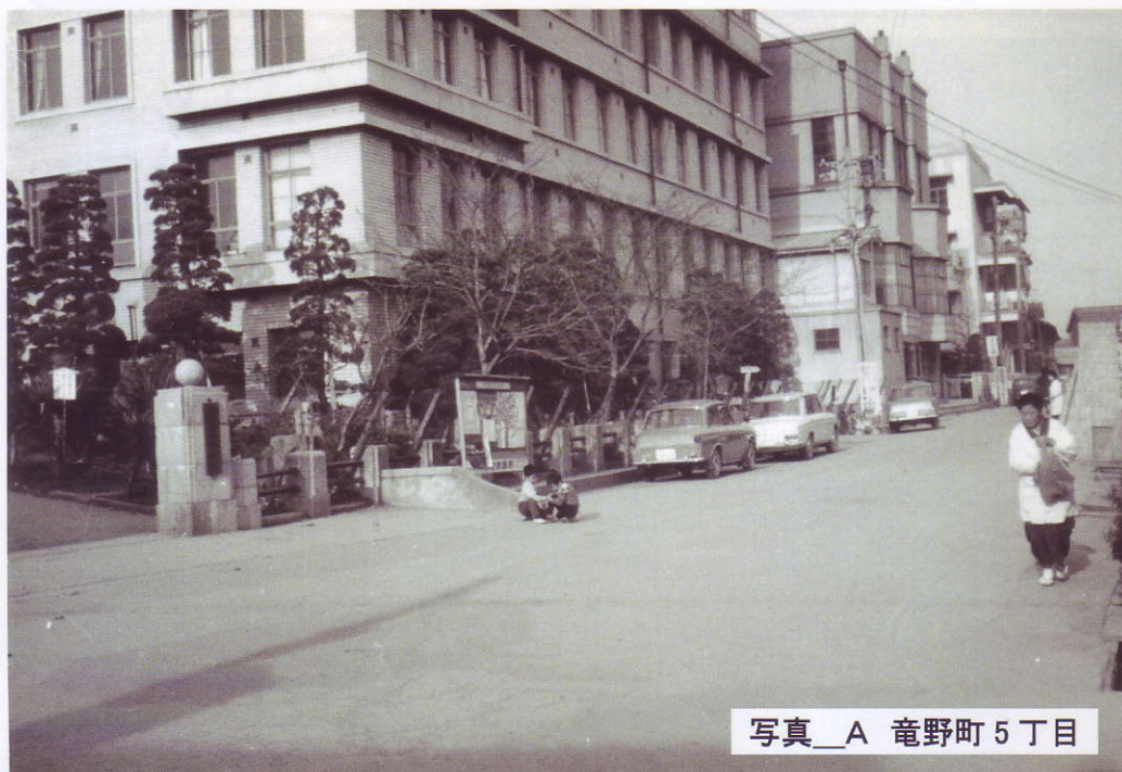
写真_A 龍野町 5 丁目

私たちの街の歴史がわかると、今の街並みがかもって輝いて見えてきますよ。(紙面作成・編集:原 隆 校了:下山裕史)