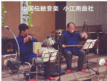
中国伝統音楽 小江南曲社