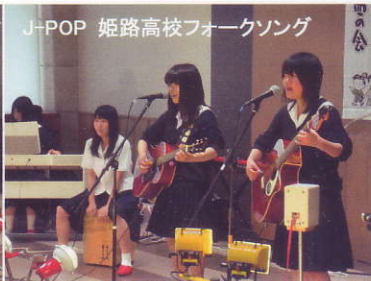
J-POP 姫路高校フォークソング