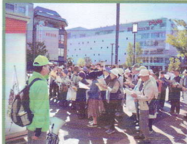
歴史ウォーク 船場城西フラリ100年 タイムトラベル

事務局●下山裕史 〒670-0035 姫路市琴岡町 266-1 tel:090-3351-7965 fax:079-296-0738